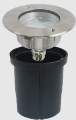
Đèn hồ bơi 6W mẫu D UW-DS6