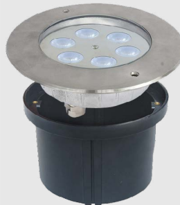
Đèn hồ bơi 12W mẫu D UW-DS12