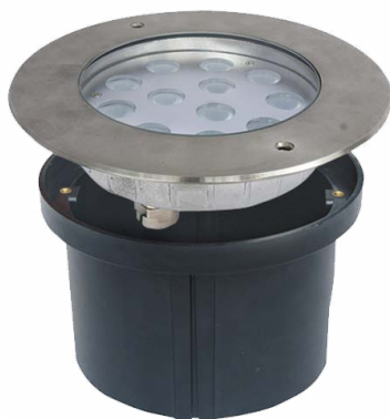
Đèn hồ bơi 24W mẫu D UW-DS24